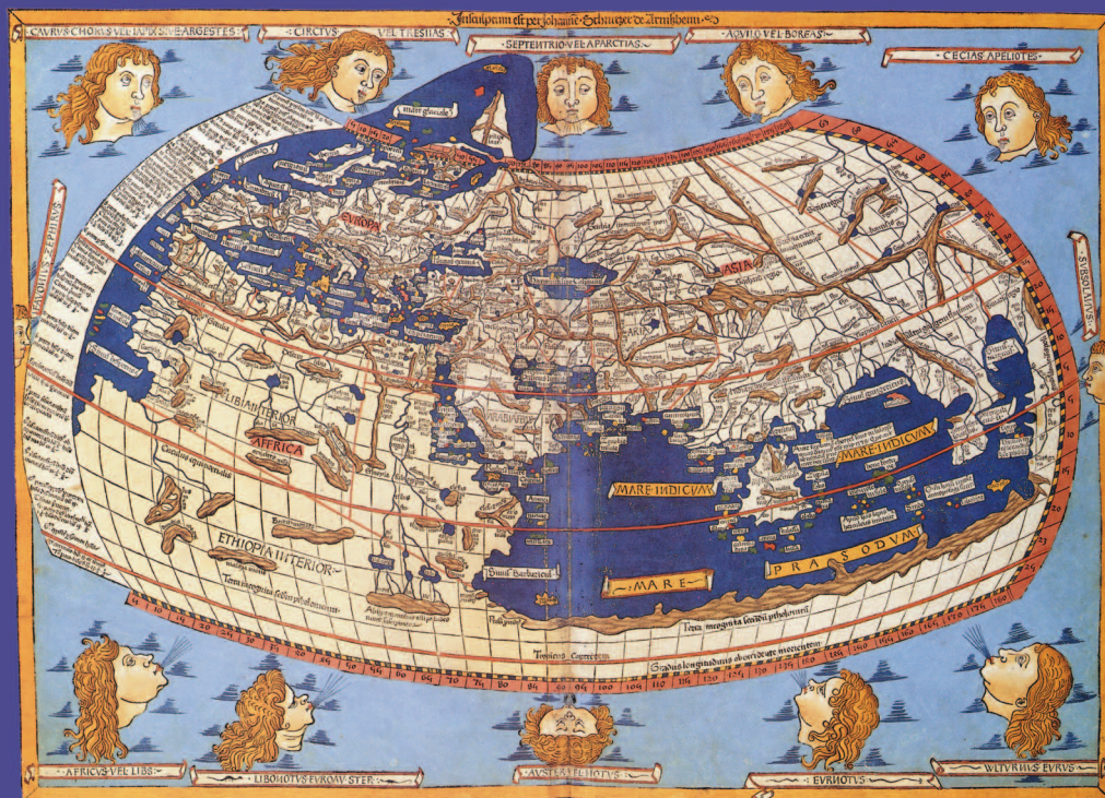
Cosmographie de Ptolémée, édition d'Ulm, 1482.