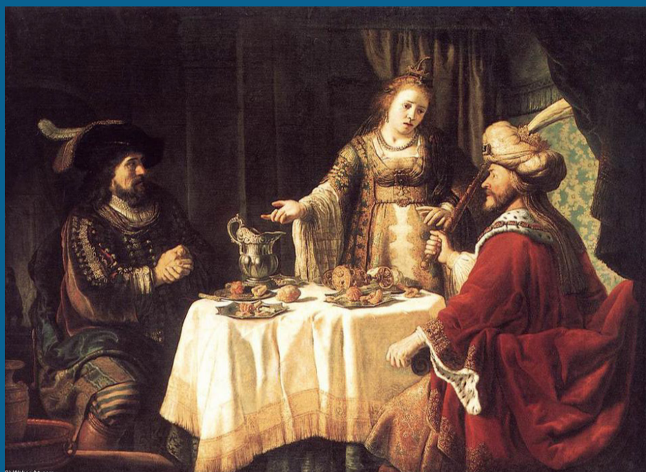
Jan Victors, Banchetto di Ester e Assuero (Staatliche Museen Kassel, 1640)