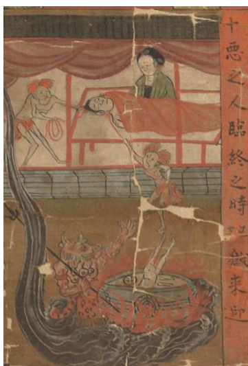
Manuscrit de Dunhuang P.2870 (détail).

Les Écoles françaises à l'étranger s'associent à ce programme avec une carte blanche intitulée « La peur des images » le 12 octobre 2018 de 15h45 à 17h15, au Château royal de Blois, Salle Gaston d'Orléans.